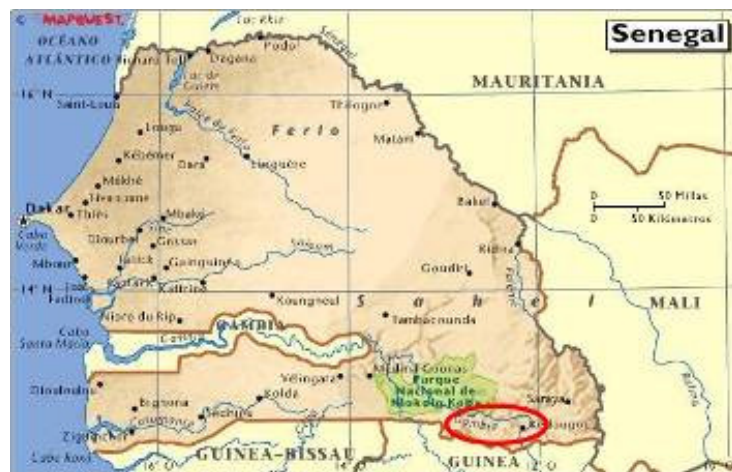
Imagen 3: Situación de la RNCD

Entre los primeros logros, el año 2010 la CRD constituyó la Reserva Natural Comunitaria de Dindéfelo (RNCD) para la gestión sostenible de los recursos naturales y la conservación de los hábitats del chimpancé. El proceso de creación y de puesta en marcha de la RNCD ha sido y está siendo asistido técnicamente por el IJGE.