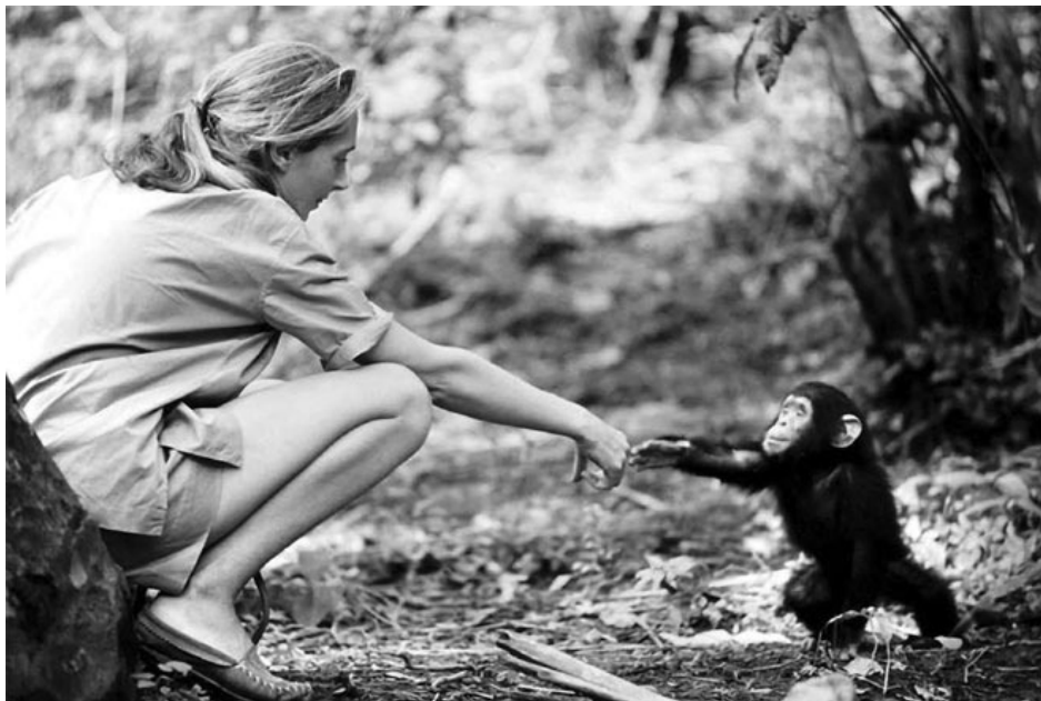
Imagen 1: Jane Goodall fue pionera en los estudios científicos a largo plazo sobre chimpancés salvajes. P.N. de Gombe, Tanzania

El Instituto Jane Goodall es una organización que toma su nombre de la famosa primatóloga británica Jane Goodall, pionera en los estudios científicos a largo plazo sobre chimpancés salvajes. En 1960, comenzó sus estudios en Tanzania y allí descubrió que los chimpancés podían elaborar herramientas, cosa que cambió la concepción que hasta el momento se tenía sobre lo que era el ser humano. Su carrera la llevó a ser una de las más reputadas activistas medioambientales, mensajera de la paz de la Organización de Naciones Unidas y doctora Honoris causa en muchas universidades. El primer Instituto Jane Goodall, creado en Reino Unido, no fue más que el inicio de la constitución de una consolidada red de organizaciones que llevan su nombre y, en la actualidad, se encuentra en 27 países, entre ellos España.