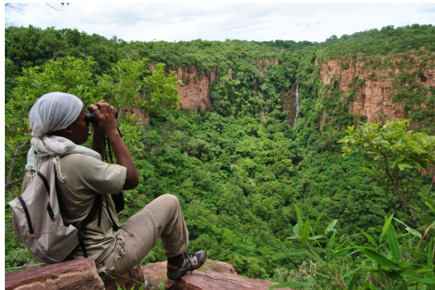
Imagen 4: Seguimiento ecológico

Las actividades de investigación sobre las comunidades de chimpancés fueron las primeras en iniciarse en 2009 en Senegal y, por tanto, es el área mejor consolidada del programa de conservación. Estas actividades se centran en el seguimiento ecológico de las comunidades de chimpancés para la obtención de datos sobre la demografía, los hábitos de nidificación, los recursos tróficos, los conflictos con los humanos y la capacidad de carga de la reserva. Estos datos son utilizados para la elaboración de estrategias de actuación y gestión con los consejos rurales y las autoridades pertinentes, por tanto, es un modelo muy válido de investigación aplicada a la conservación in situ .