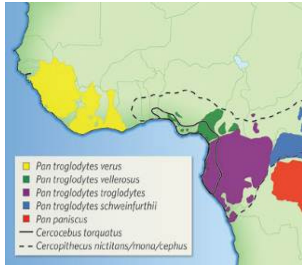
Imagen 2: Distribución de las subespecies de Pan troglodytes

En este contexto, desde 2009 el IJGE trabaja en la región de Kédougou, concretamente en la Comunidad Rural de Dindéfelo (CRD), en un proyecto de gestión del territorio llevado a cabo por la Dirección de Aguas y Bosques y el Ministerio de Medio Ambiente de Senegal, y apoyado en sus inicios por el