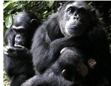
Fifi y dos de sus crías

Flossi se mudó a la comunidad de Mitumba, en el norte del parque nacional, y es madre de Forest, Fansi, Flower, Falidi y ahora el pequeño Fede , nacido en 2012.