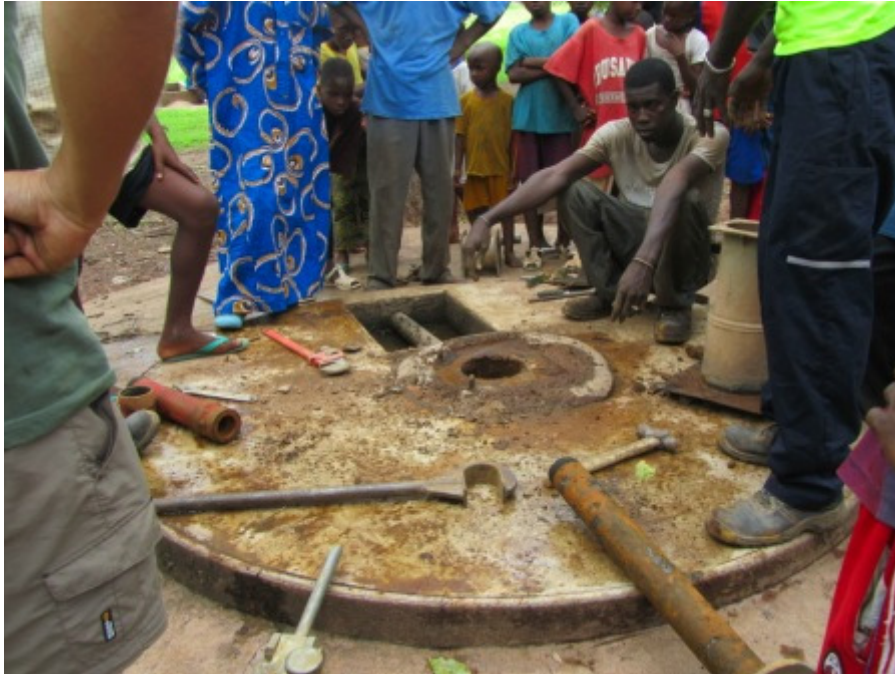
Forage desmontado para confirmar la avería

Las actividades benéficas y donaciones del grupo R&S Madrid han permitido que sus integrantes hayan podido recaudar la cantidad necesaria para la reparación del pozo profundo (llamado forage en Senegal) que estaba averiado desde principios de Julio de 2012.