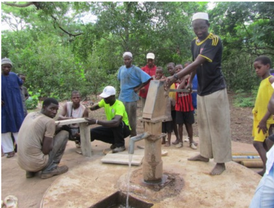
Uno de los consejeros inaugura el forage reparado

Los miembros de R&S Madrid han enviado más de 350 euros para que la población de Goumbambere vuelva a tener agua potable. Se cambió el tubo central, las barras metálicas centrales, se soldaron dos piezas rotas y se cimentó la base para sellarla.